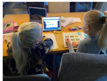
(Gryte Marrit en Femma)